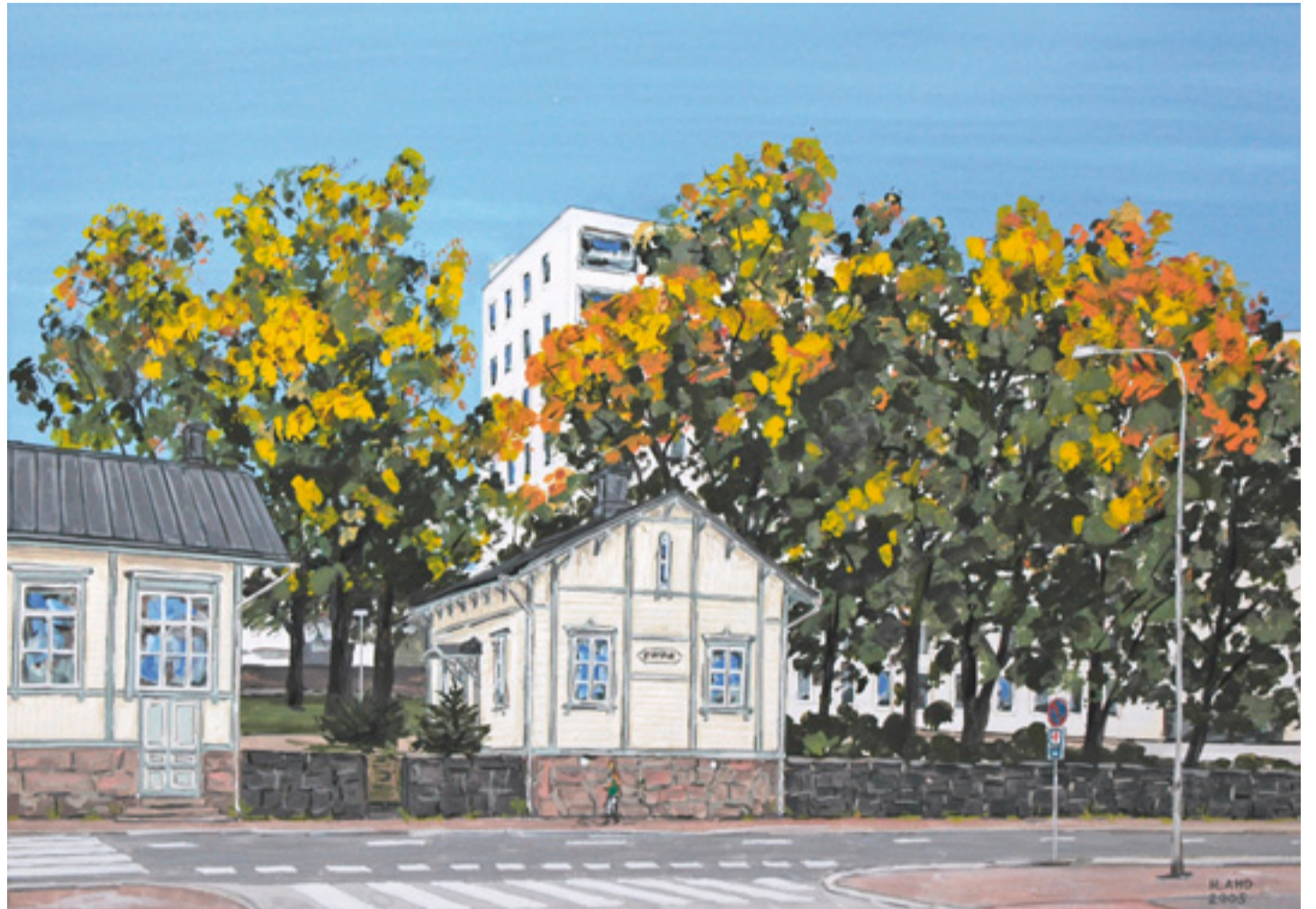
Portinvartijan talo, jossa Lasarettimuseo sijaitsee, on jo itsessään idyllinen muisto menneiltä vuosilta. Kuva Heikki Ahon maalauksesta.

Lasarettimuseoon mielitään saatavan lisäksi myös valokuvia, erilaisia lehtikirjoituksia sekä vanhoja kuvaluettelaita ja -kirjoja, joista ilmenisivät sairaaloesineistön nimet ja käyttötarkoitukset, sillä vielä