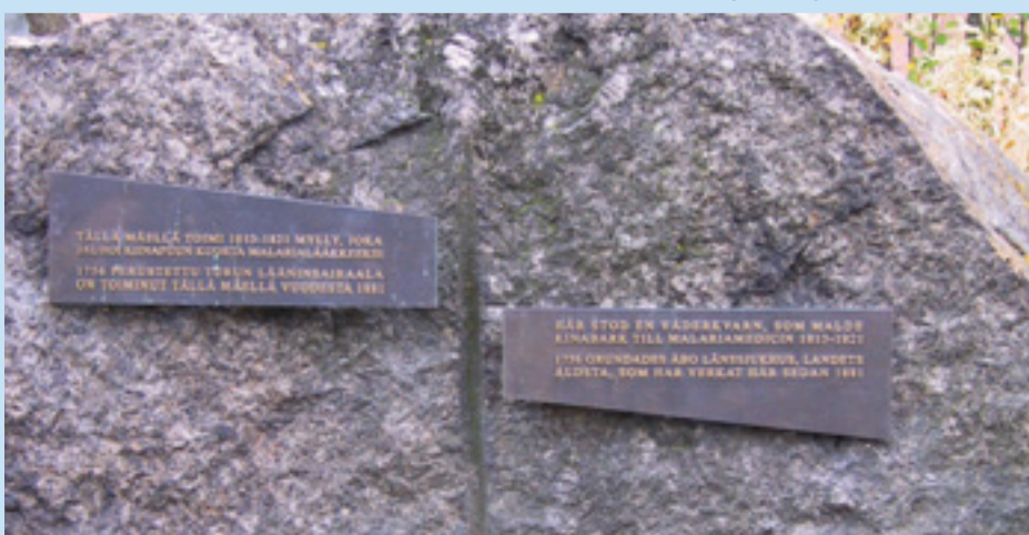
Sairaala-alueella toimineesta Kiinamylystä muistuttaa TYKSiin keskuspuistikossa oleva suuri muistokivi, joka asetettiin paikalleen lokakuussa 2003 Turun lääketieteen historiayhdistyksen, Kiinamylyn killan ja rakennusliike Hartelan yhteistyönä. Muistolaaat suunnitteli arkkitehti Ola Laiho.