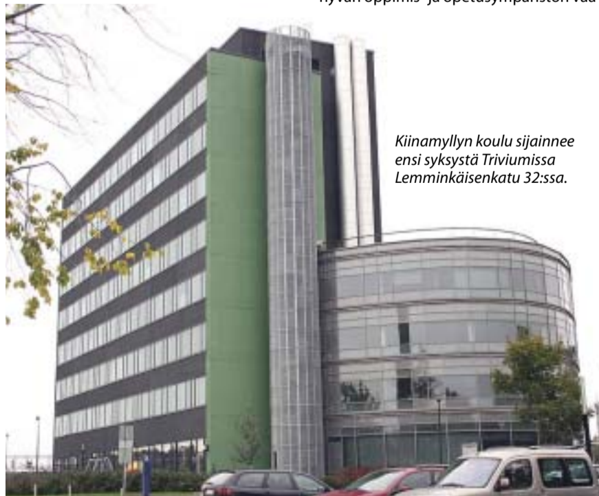
Kiinamyllyn koulu sijainnee ensi syksystä Triviumissa Lemminkäisenkatu 32:ssä.