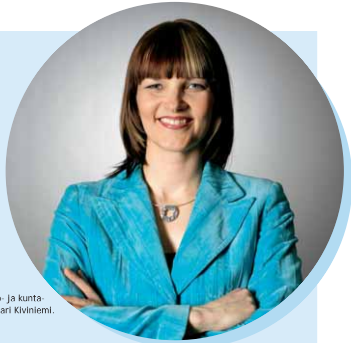
Hallinto- ja kuntaministeri Mari Kiviniemi.

Kuntakoon suureneminen vaikuttaa myös siten, että sairastavuuden satunnaisvaihtelun vaikutus kuntakohtaisessa laskutuksessa pienenee ja kuntatalouden ennustettavuus paranee. Kuntien keskinäinen tasapaino myös lisääntyy koska vaihtelut kuntakoossa vähenevät.