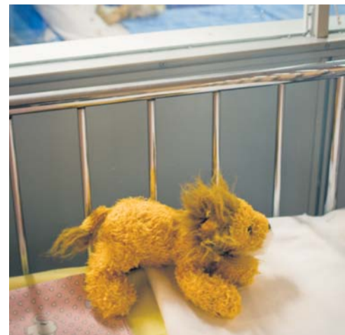
På barnavdelningen är det första intrycket ofta viktigt.

Alla kan de ha lite tröst av att allt här inte är krom, plast och lysrör. I patientköket kan man alldeles som hemma sitta på en röd pinnstol och äta sin mat vid ett bord med vaxduk. Bara några i taget. Se ut över stan och på trafiken som brusar förbi. Kanske njuta av livet.