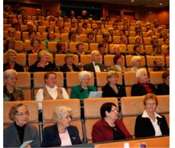
Salin täydeltä Senioreita.