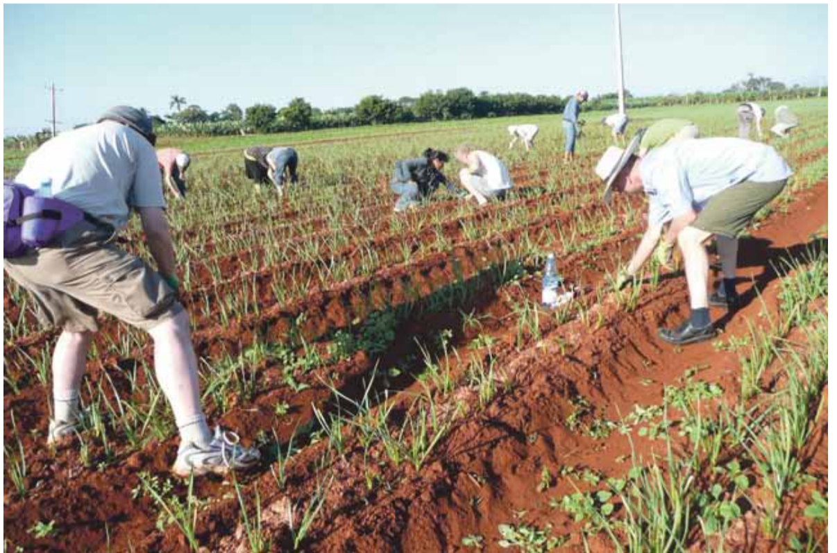
Ain laulain työtäs tee... valkosipulipenkkejä piisasi.

Vaikka YK on yleiskokouksessaan 18 kertaa tuominut USA:n julistaman kauppasaarron, se puree yhä ja aiheuttaa omat ongelmansa jokapäiväiseen elämään. Kaikesta huolimatta kuubalaiset avustavat toisia köyhiä maita enemmän kuin rikkaat EU-maat. He lähettävät myös terveydenhuollon am-