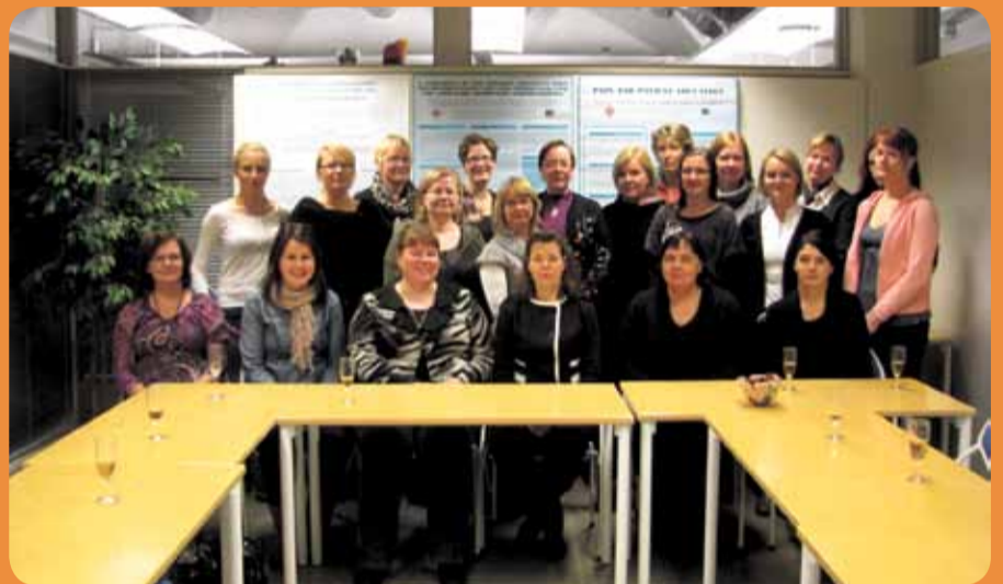
Opintojaksolle osallistuneet hoitajat, yliopiston luennoitsijat sekä sairaanhoitopiiristä tuutorit ja koordinoijat potretissa.